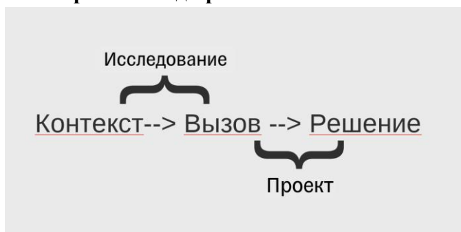
Схема работы над проектом:

ВАЖНО! Не надо реализовывать проект/механизм/инструмент решения проекта. Например, не надо разрабатывать сервис или строить модель. Необходимо подготовить КОНЦЕПЦИЮ .