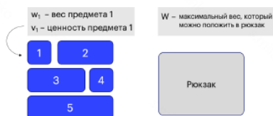
Рисунок 1. Иллюстрация задачи

Рюкзак У нас есть рюкзак, который может выдержать набор предметов весом не более W .