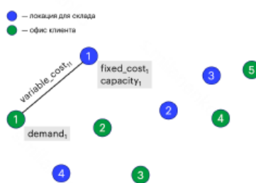
Рисунок 2. Иллюстрация задачи

Операционная модель Компания работает так: в течение недели склады постепенно пополняются, а в понедельник утром вся вода одновременно отправляется клиентам. Один склад может обслуживать несколько клиентов, а один клиент может получать воду из разных складов. Доставка одной партии воды из склада в локацию i до офиса j стоит \text{variable\_cost}_{ij} .